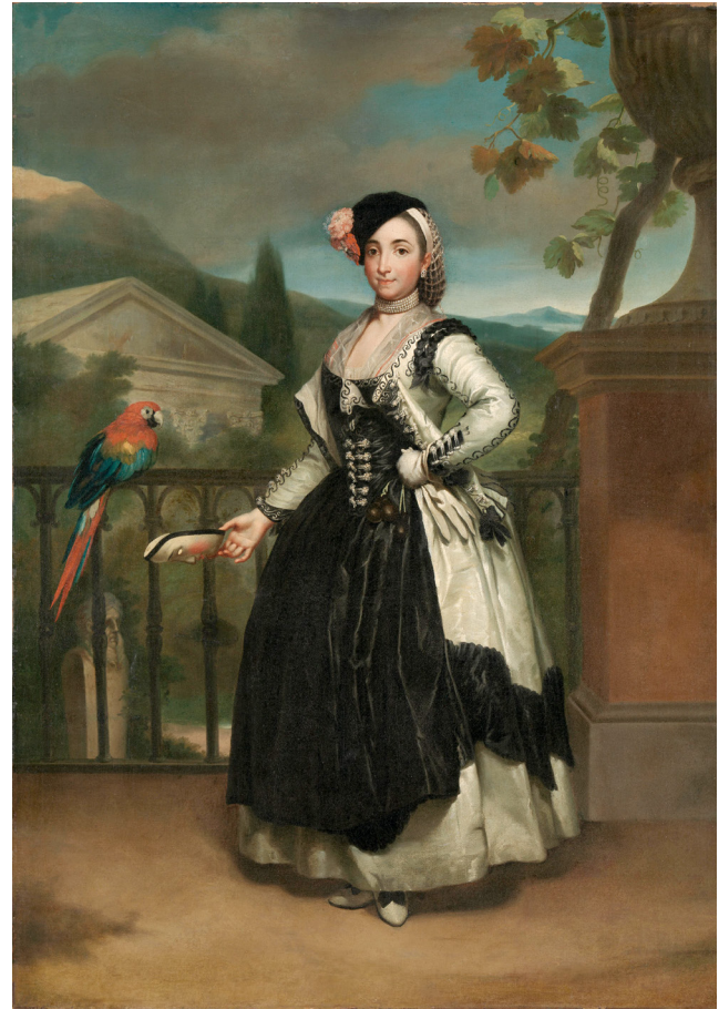
Abb. 7 Anton Raphael Mengs, Isabel Parreño y Arce, Marquise de Llano (Replik), 1771/72. Amsterdam, Rijksmuseum, Inv.-Nr. SK-A-3277

bewies der junge Künstler, dass er die Lücke, die der 1748 aus dem sächsischen Hofdienst ausgeschiedene Louis de Silvestre (1675–1760) hinterlassen hatte, mehr als zu füllen wusste: Um 1750 geschaffen, stehen diese Werke zum einen in der Tradition der auch für den Dresdner Hof vorbildlichen französischen Paradebildnisse des Hochbarock, der sich Silvestre ebenfalls noch verpflichtet zeigte. Mit den gesuchten malerischen Effekten und den lebensnahen Physiognomien gehen sie andererseits bereits über die Formelhaftigkeit dieser »portraits d'apparat« hinaus. Vergleichbare Eigenschaften demonstriert auch das Pastellbildnis des künftigen Kurfürsten Friedrich August III. als Kind ( Abb. 4 ), das Mengs 1751 und damit im Jahr seiner Ernennung zum Oberhofmaler schuf: 6 So natürlich Gebärden und Mimik des auf einem Kissen ruhenden Säuglings erscheinen, so selbstverständlich integriert der Maler die von der Bildaufgabe geforderten Hinweise auf den fürstlichen Rang des Dargestellten. Dieses innovative Kinderporträt weist nicht zuletzt in der meisterhaften Erfassung der verschiedenen Stofflichkeiten