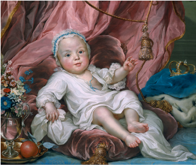
Abb. 4 Anton Raphael Mengs, Kurfürst Friedrich August III. als Kind , 1751. Staatliche Kunstsammlungen Dresden, Gemäldegalerie Alte Meister, Inv.-Nr. P 176