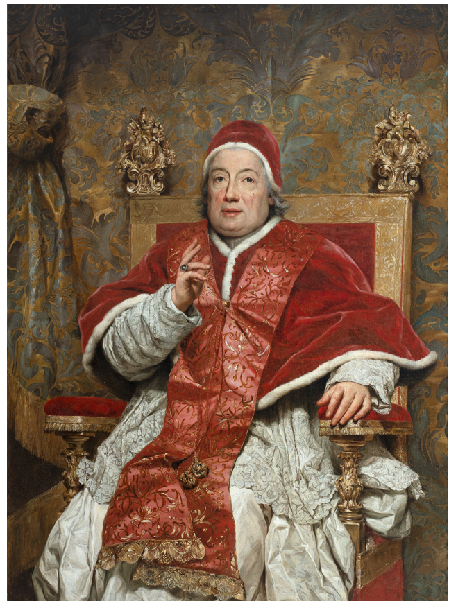
Abb. 5 Anton Raphael Mengs, Papst Clemens XIII. , 1758. Venedig, Ca'Rezzonico

Letztlich bereitete erst der zweite Aufenthalt in Rom Mengs darauf vor, den Aufgaben eines obersten Hofmalers vollumfänglich nachzukommen, zu denen neben der Historienmalerei, die als die vornehmste Gattung der Malerei galt, auch die Anfertigung repräsentativer Herrscherporträts zählte. Mit dem (nur noch im Bozzetto bekannten) Ganzfigurenporträt Friedrich Augusts II. und den Pendantbildnissen von Kronprinz Friedrich Christian und dessen Ehefrau Maria Antonia von Bayern ( Abb. 2, 3 )