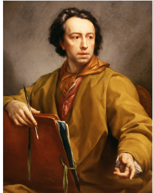
Abb. 8 Anton Raphael Mengs, Selbstbildnis , 1773. Florenz, Galleria degli Uffizi, Inv.-Nr. 1927 (Inventar 1890)