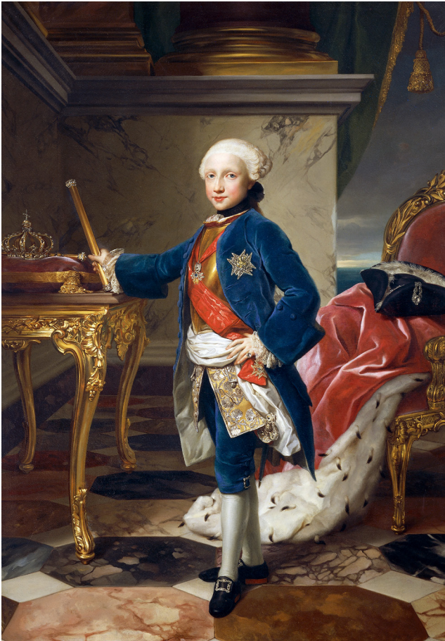
Abb. 6 Anton Raphael Mengs, Ferdinand IV. von Neapel , 1759/60. Neapel, Museo di Capodimonte, Inv.-Nr. 83814