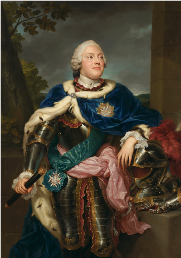
Abb. 2 Anton Raphael Mengs, Kurprinz Friedrich Christian , 1751. Los Angeles, The J. Paul Getty Museum, Inv.-Nr. 2023.100