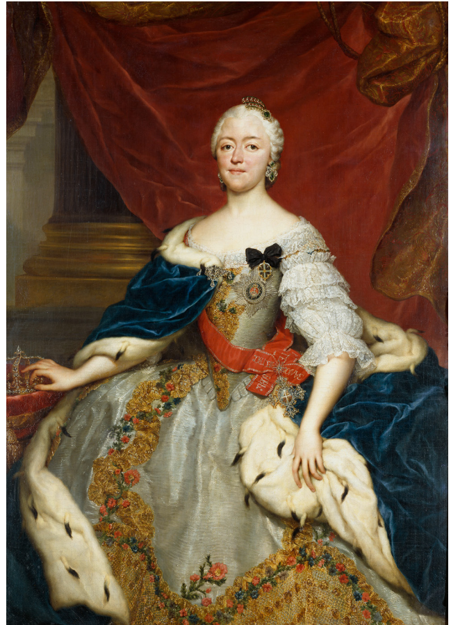
Abb. 3 Anton Raphael Mengs, Maria Antonia von Bayern , 1751. Staatliche Kunstsammlungen Dresden, Gemäldegalerie Alte Meister, Inv.-Nr. 2163